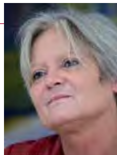
Christine Van Broeckhoven

Elke mens heeft het individuele recht op een vrije keuze voor een waardig levenseinde. Het is de plicht van onze maatschappij om dat recht te vrijwaren.